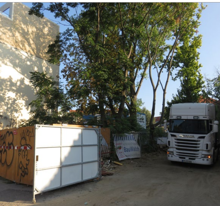
Abbildung 6: Grundstücksansicht

Im Übrigen ist das Grundstück unbebaut und es bestehen keine Miet- oder sonstigen Nutzungsverhältnisse. Es existiert lediglich eine Nachbarvereinbarung ( vgl. Anlagenkonvolut zu Anlage 5 Erbbaurechtsvertragsentwurf ) zwischen der Liegenschaftsfonds Berlin GmbH & Co. KG und dem Eigentümer der Invalidenstraße 5 über die temporäre Nutzung des Grundstücks Ackerstraße 28 zur Durchführung des Bauvorhabens in der Invalidenstraße 5. Die Rückgabe des Grundstücks Ackerstraße 28 erfolgt voraussichtlich bis spätestens zum 31.03.2023. Zudem sind die Festlegungen zur Gestaltung der Grenzwall gemäß § 7 der Nachbarvereinbarung, insbesondere dort die Regelungen zur Kostenübernahme in Ziffer 7.5 zu beachten.