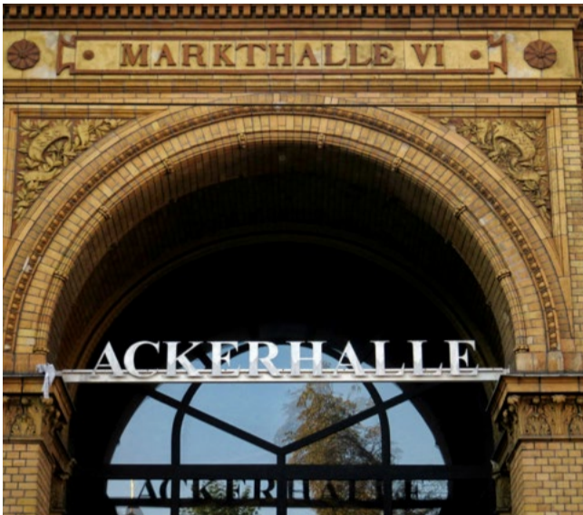
Abbildung 2: Ackerhalle

Äußeres sich noch im Originalzustand befindet. Sie wurde zwischen 1886 und 1892 durch den Berliner Magistrat für den Einzelhandel errichtet und beherbergt seit der Sanierung 1990/91 einen Supermarkt.