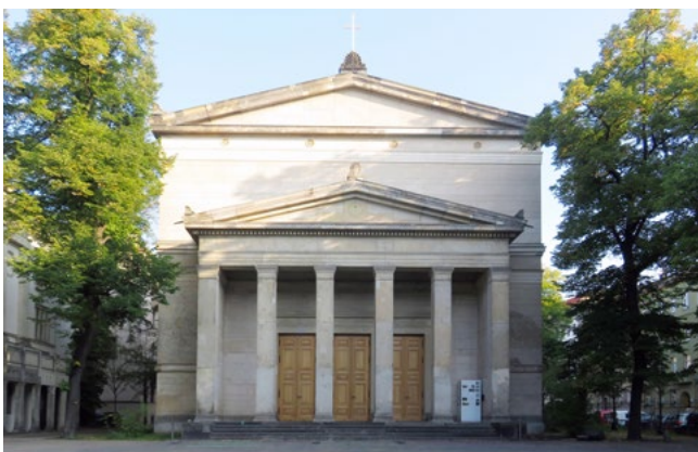
Abbildung 3: Schinkel'sche Elisabethkirche

Gegenüber der Ackerhalle und neben dem Grundstück Ackerstraße 28 steht die Ruine der St. Elisabeth-Kirche, das älteste Gebäude der Rosenthaler Vorstadt. Sie wurde zwischen 1832 und 1834 nach Entwürfen von Karl Friedrich Schinkel errichtet. Der imposante Sakralbau blieb nach seiner Zerstörung im Zweiten Weltkrieg eine Ruine und wird seit seiner Sanierung 1999 für kulturelle Zwecke genutzt.