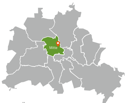
Abbildung 1: Übersicht Berliner Bezirke

Das Grundstück Ackerstraße 28 befindet sich im Berliner Bezirk Mitte, Ortsteil Mitte, in der sogenannten Rosenthaler Vorstadt.