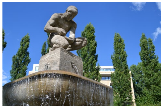
Abbildung 4: Geldzählerbrunnen

Gegenüber dem Grundstück Ackerstraße 28 liegt der Pappelplatz, auf dem sich der 1912 erbaute historische „Geldzählerbrunnen“ mit der Skulptur „Erbsezähler“ befindet.